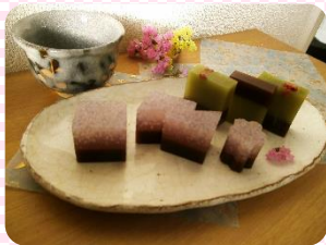
※道明寺入桜羊羹&抹茶※