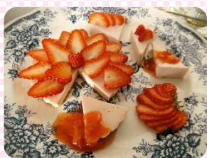
※いちごチーズケーキ※